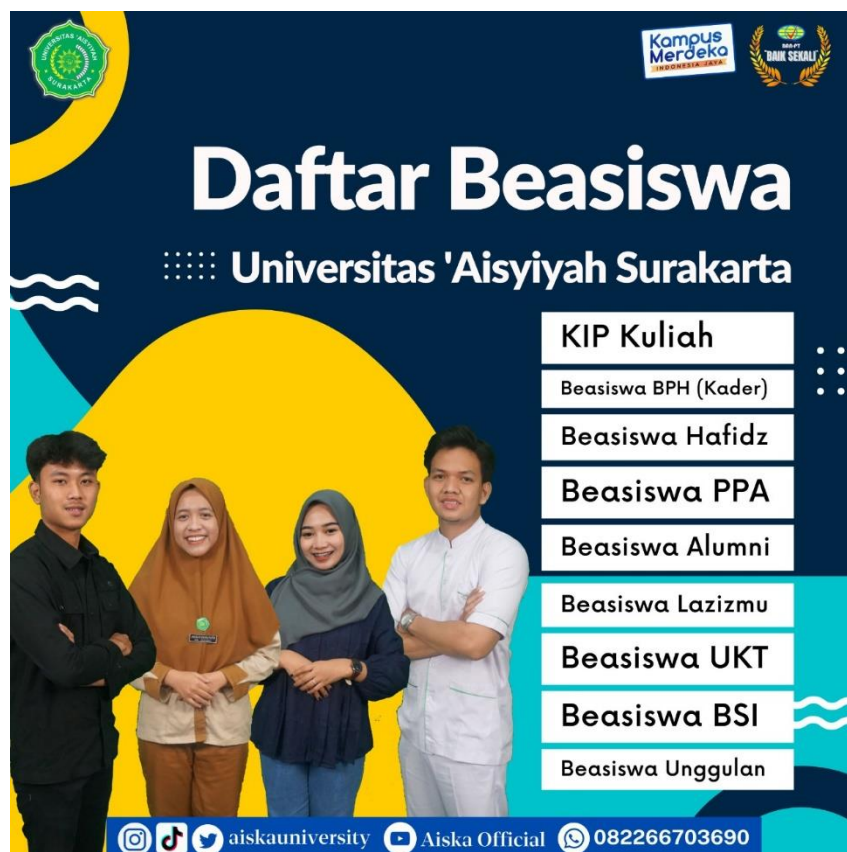
Gambar 2.2 Daftar Beasiswa AISKA

Berikut daftar beasiswa yang di sediakan oleh Universitas 'Aisyiyah Surakarta :