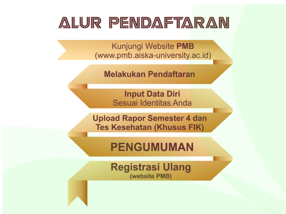
Gambar 4.1 Alur Pendaftaran Mahasiswa Baru AISKA

Pendaftaran mahasiswa baru di Universitas `Aisyiyah Surakarta dapat dilakukan dua cara, yaitu dengan datang dan daftar langsung ke kampus 1 ruang PMB lantai 2 dan caa kedua yaitu secara online melalui → https://pmb.aiska-university.ac.id dengan alur pendaftaran berikut ini :